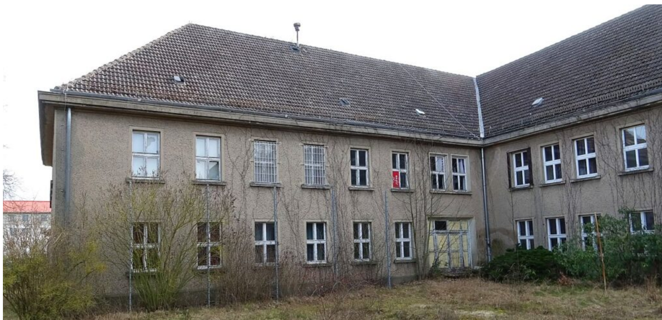
Blick auf linken Flügel des Stabsgebäudes des Kfz-Regiment 2 – Aufnahme Februar 2024