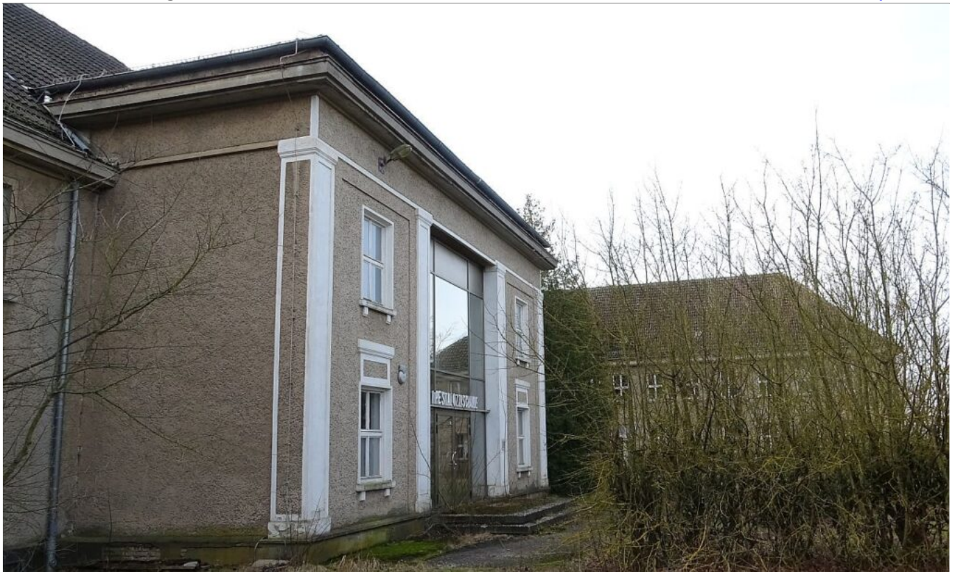
Blick auf rechten Flügel des Stabsgebäudes des Kfz-Regiment 2 – Aufnahme Februar 2024

Im rechten Flügel des Gebäudes befanden sich die Räumlichkeiten der 1. Kompanie .