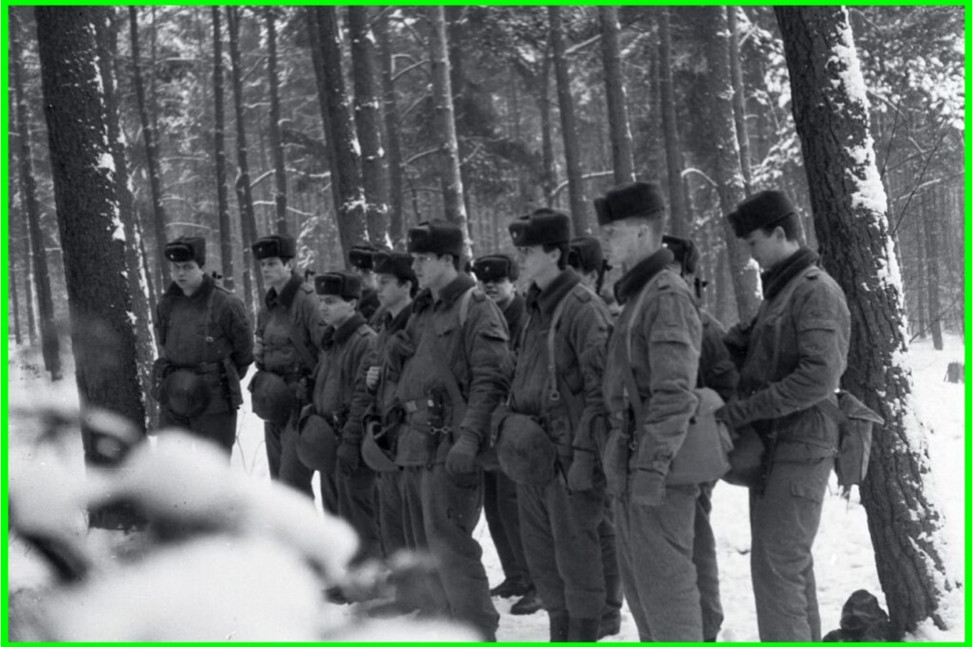
Einweisung in die zu erfüllenden Aufgaben