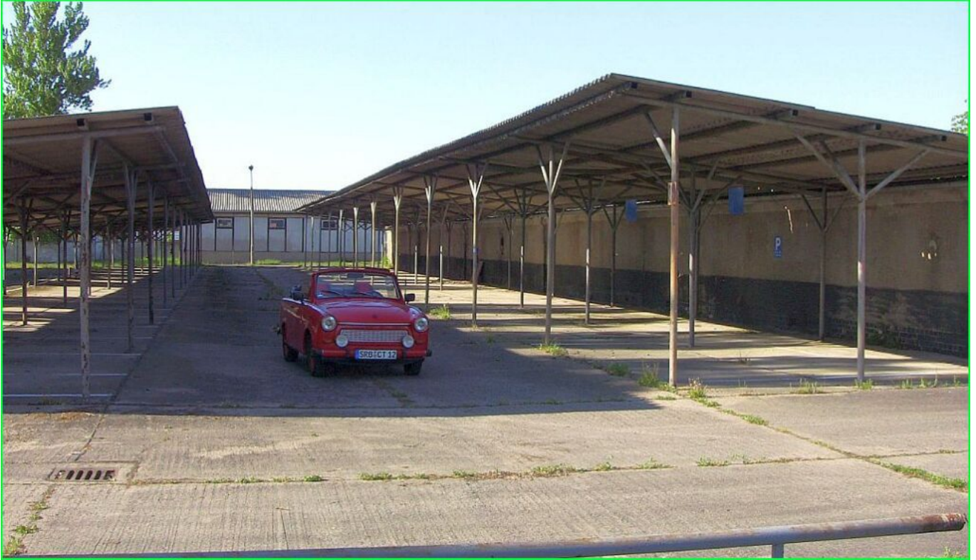
verwaiste Kfz- Stellplätze der 5. Kompanie im Jahr 2009