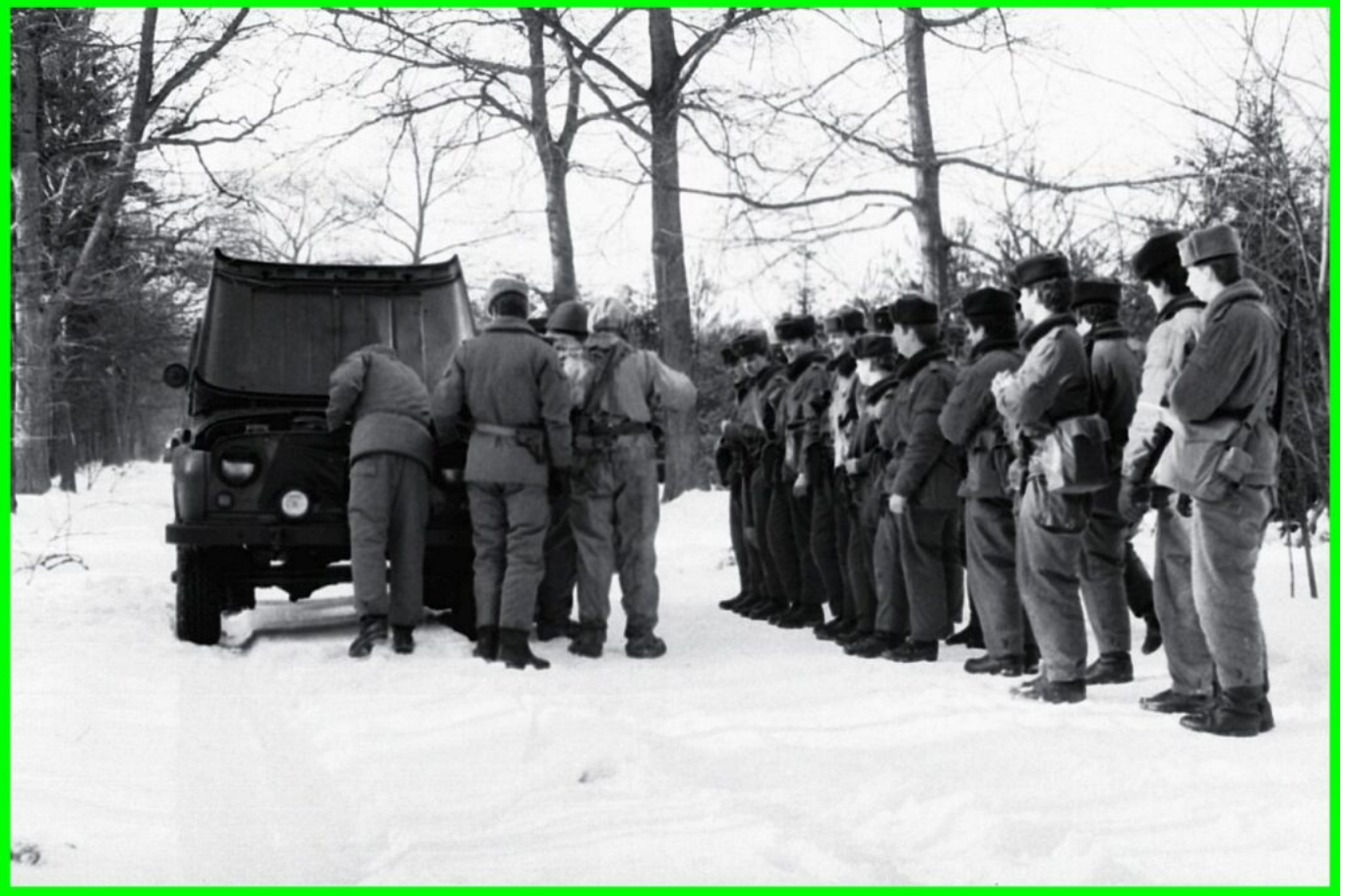
Einweisung in Training