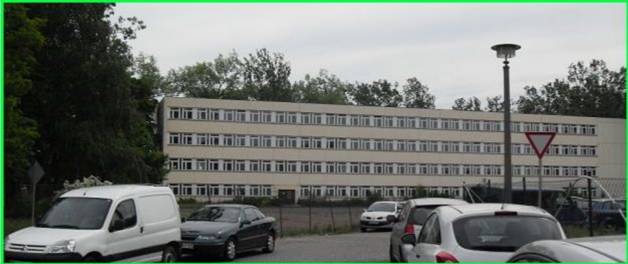
Blick auf den ehemaligen Unterkunftsblock der 5. bis 9. Kompanie. Er wurde abgerissen. Jetzt steht dort ein neuer Block der Bundeswehr.