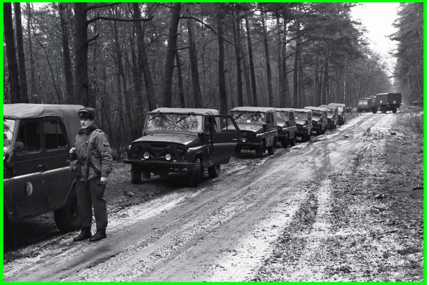
Marschband der 5. Kompanie