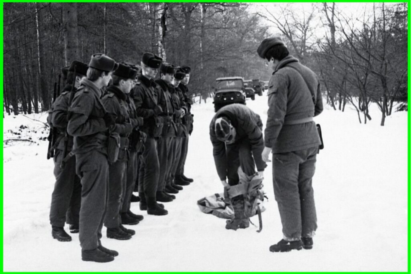
Lehrvorführung Schutzanzug anlegen