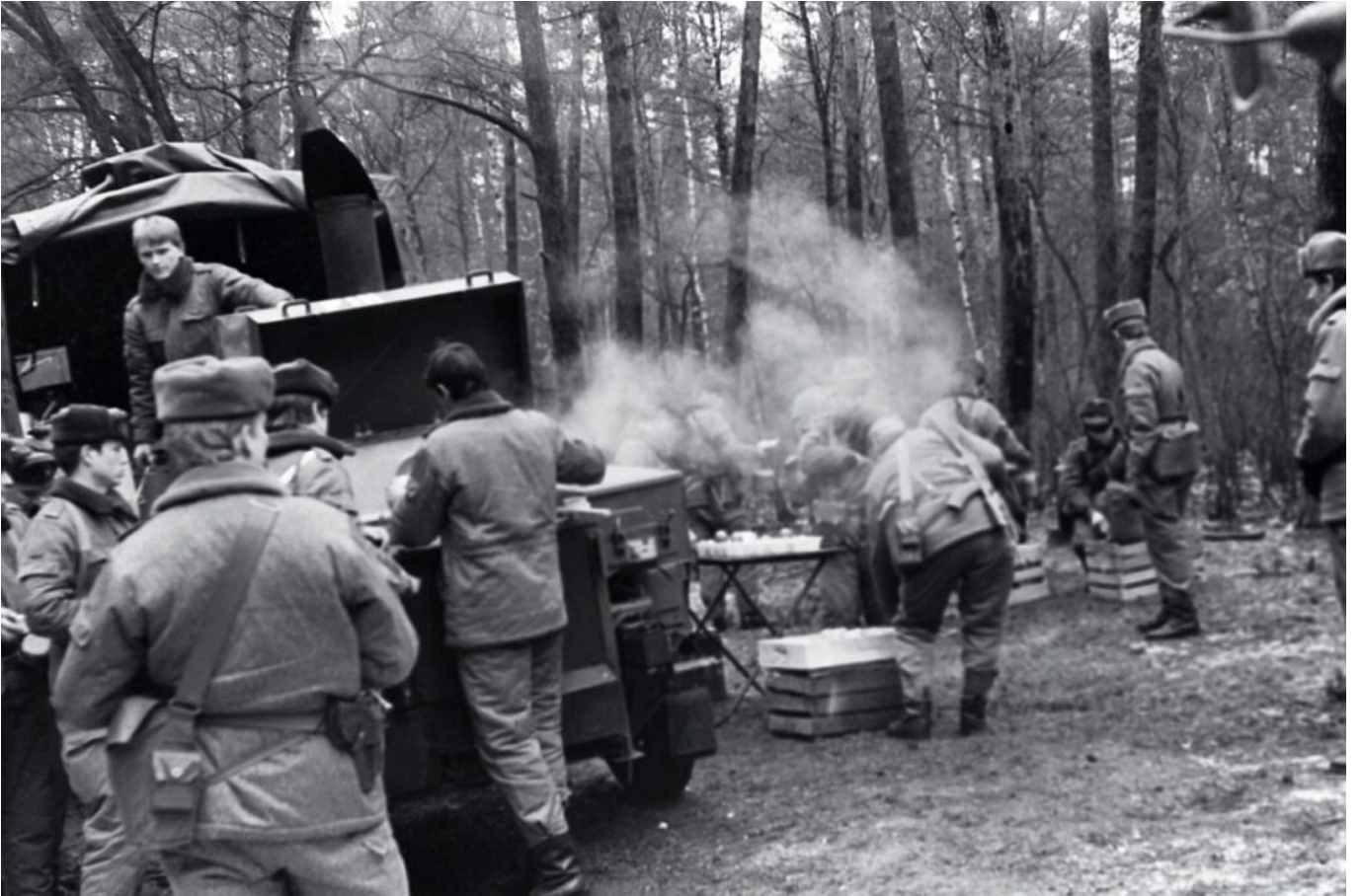
Essenausgabe 5. Kompanie