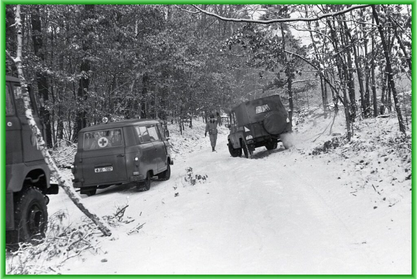
B1000 Sankra bei Kompanieübung