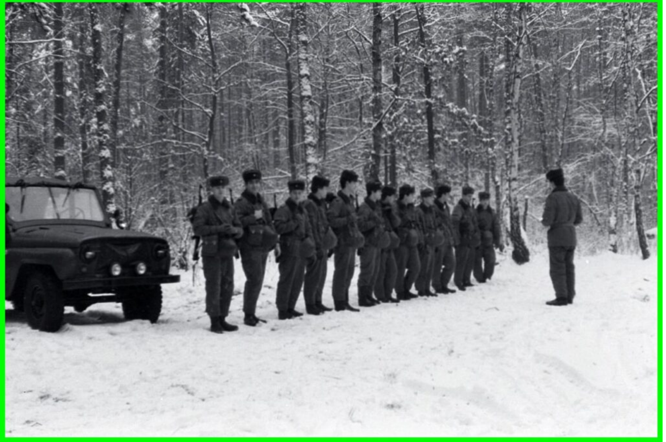
Gruppeneinweisung durch Zugführer