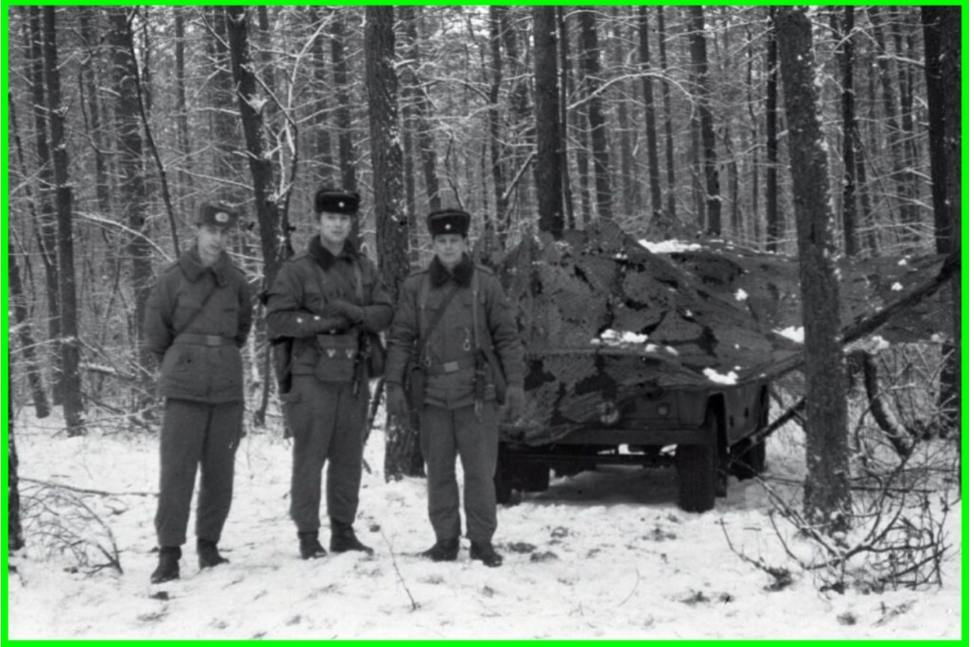
Gruppenfoto 2 Fw Leis