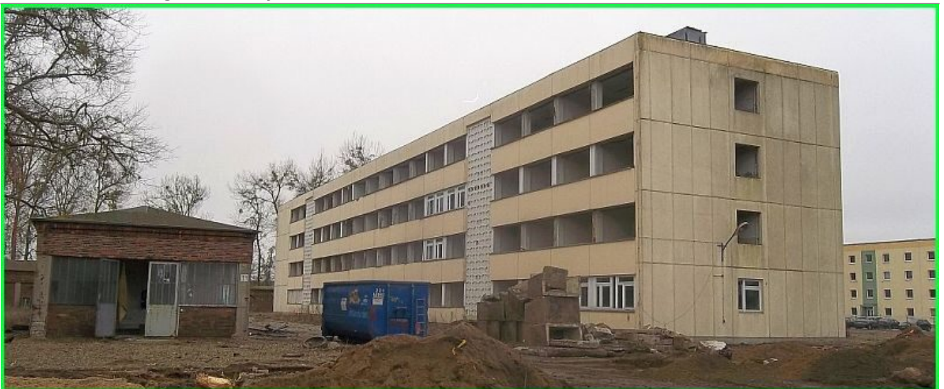
Rückseite des Unterkunftsblockes der 5. bis 9. Kompanie während des Abrisses, links im Backsteinbau die Funkwerkstatt, dahinter der Gas-Testraum (nicht sichtbar) . Rechts im Hintergrund der Block der 2. und 3. Kompanie.