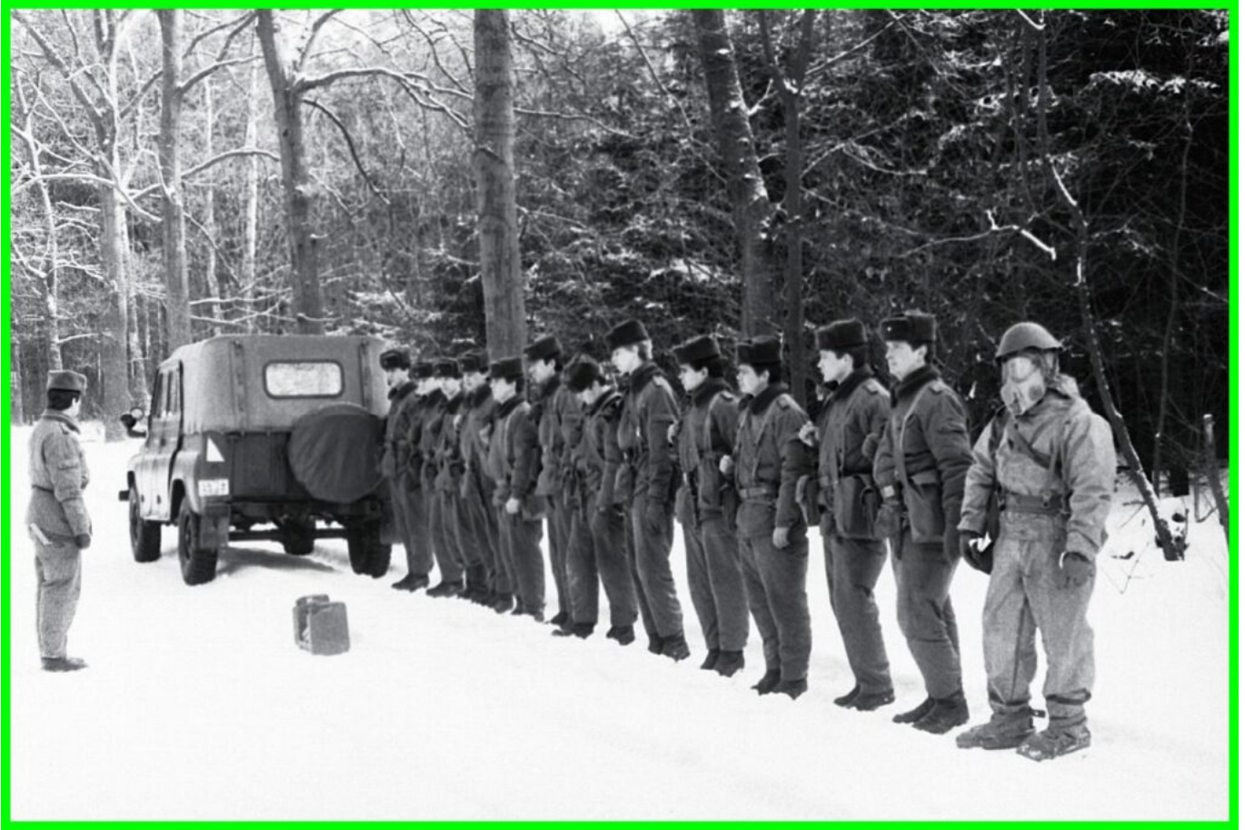
Einweisung in die Fahrzeugentgiftung