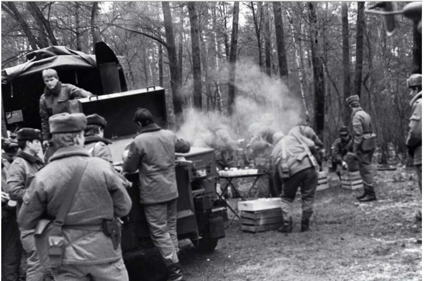
Feldküche Fkü 180/72 M im Einsatz bei einer Kompanieübung der 5. Kompanie des Kfz-Regiment 2