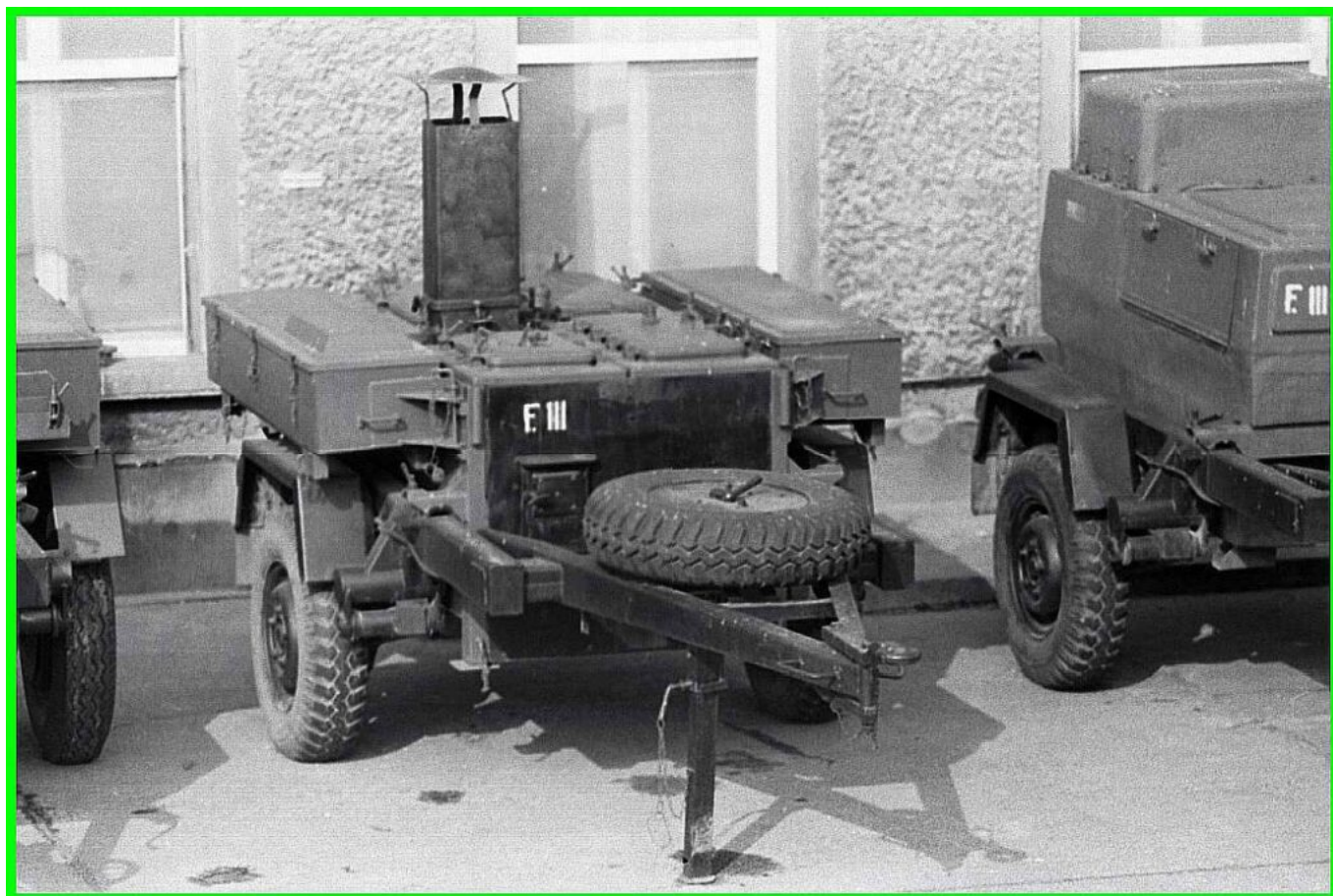
Feldküche FkÜ 180/72 des Küchenzuges des Kfz-Regiment 2