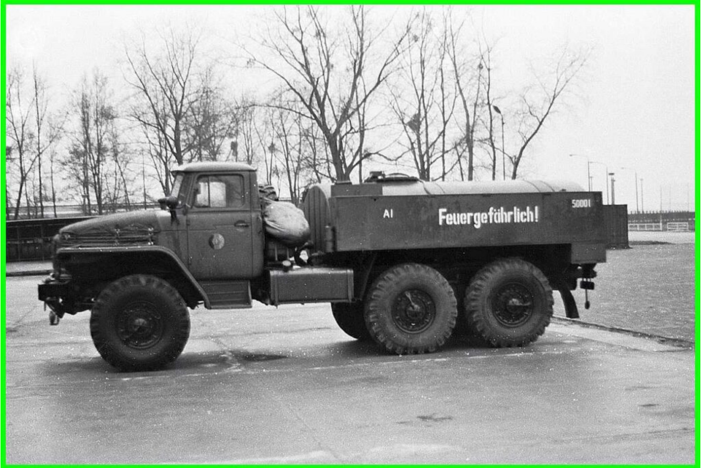
Tankwagen der 9. Kompanie URAL der 9. Kompanie