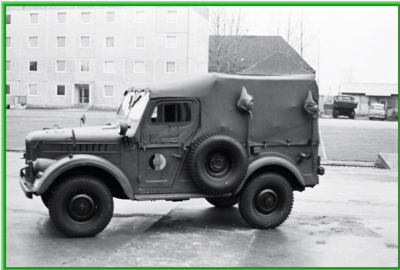
GAZ 69 Funkausführung auf Ex-Platz mit Blick auf den Unterkunftsblock der PKW-Kompanien

EK- Feiern der 9. Kompanie auf dem Schießplatz Wilkendorf