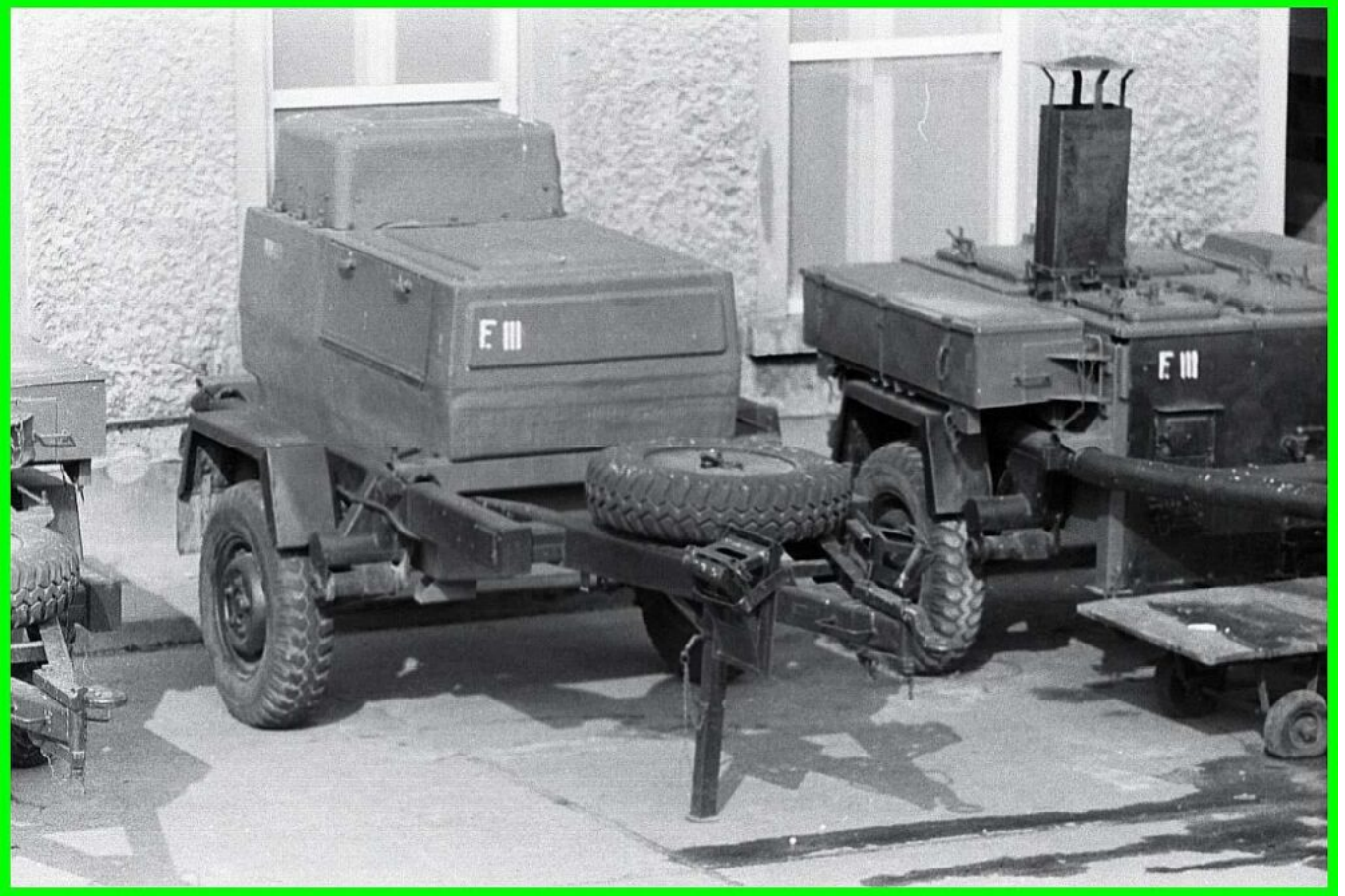
Wassertransportanhänger des Küchenzuges