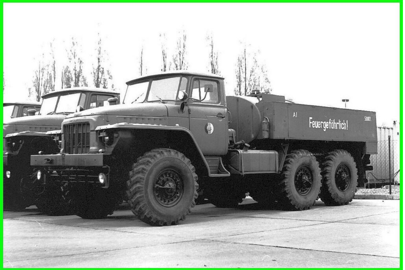
9. Kompanie - Tankwagen URAL 375D