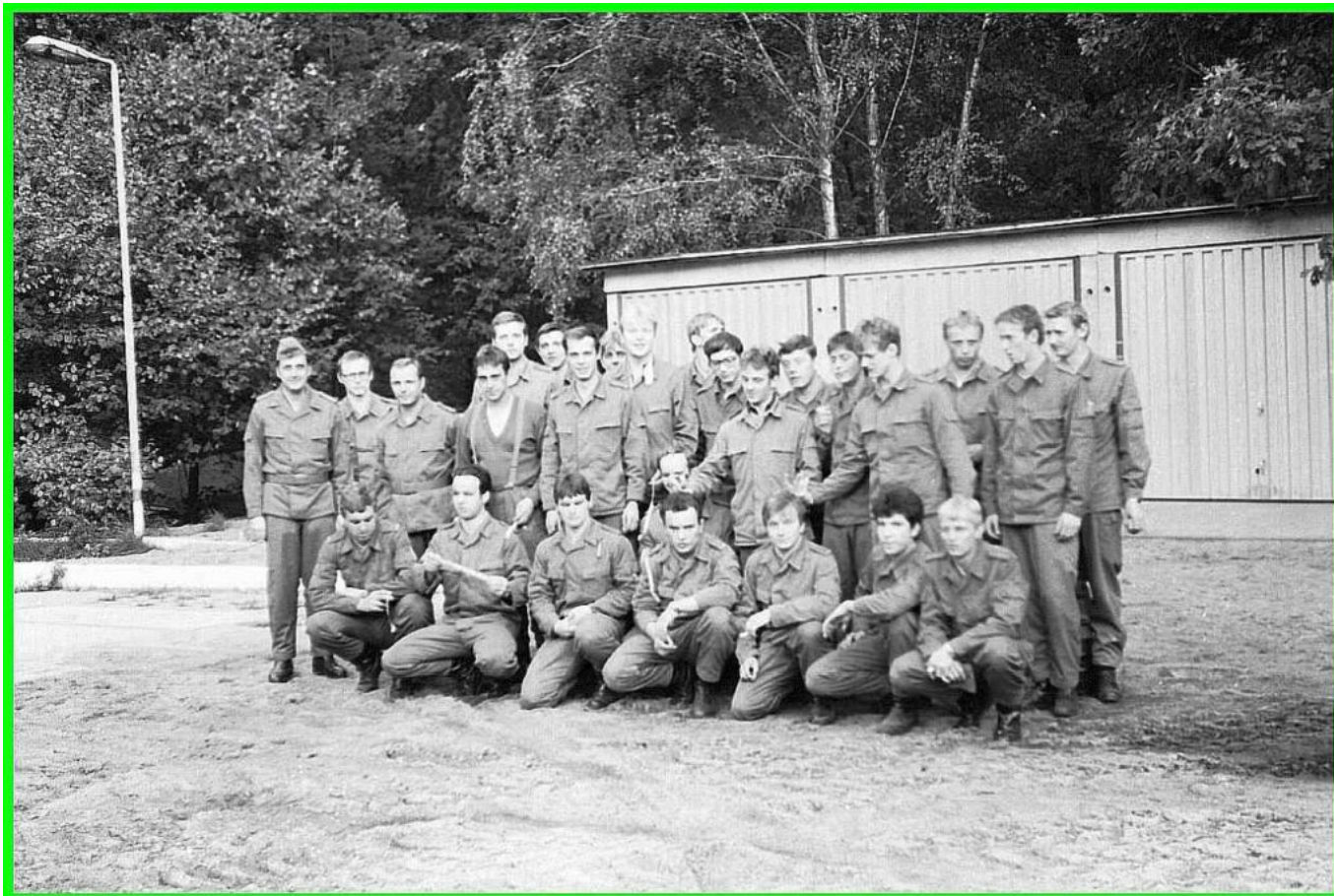
EK-Feier auf Schießplatz Wilkendorf – das Bandmaß ist nur noch 30 cm lang!