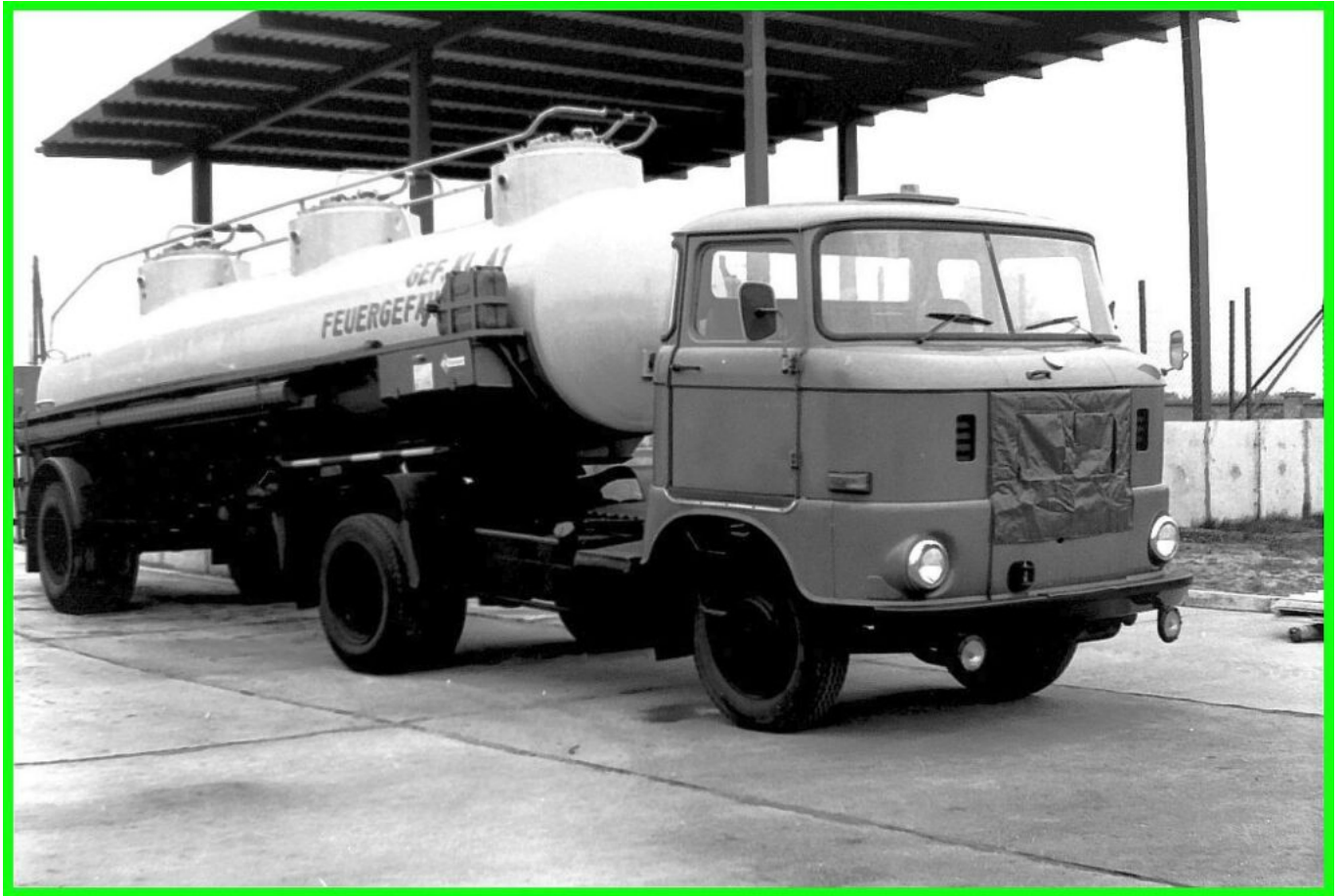
W50- Tankzug der 9. Kompanie