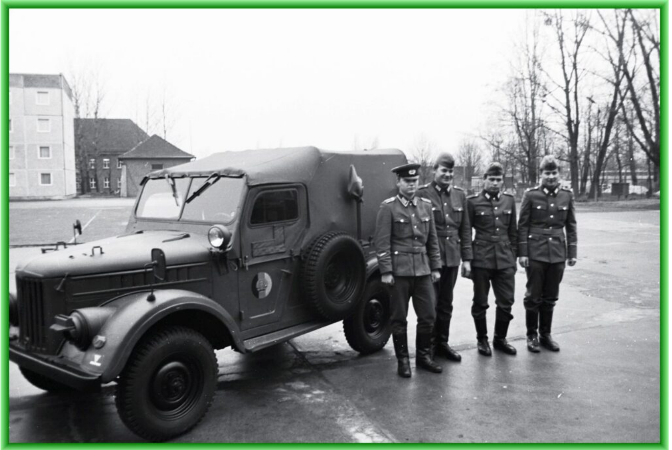
Funkerguppe mit Gruppenführer